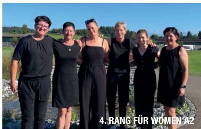
4. RANG FÜR WOMEN A2