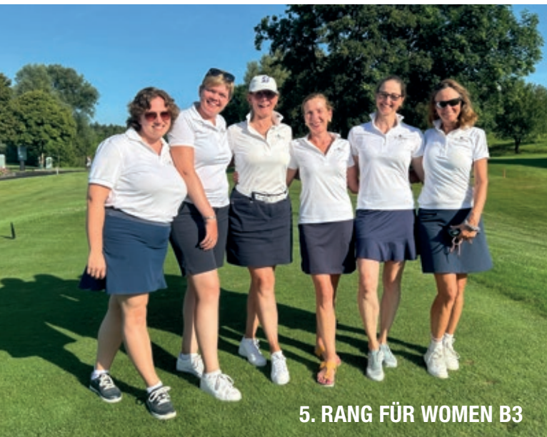
5. RANG FÜR WOMEN B3