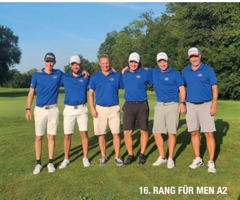
16. RANG FÜR MEN A2