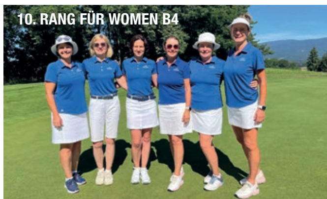
10. RANG FÜR WOMEN B4