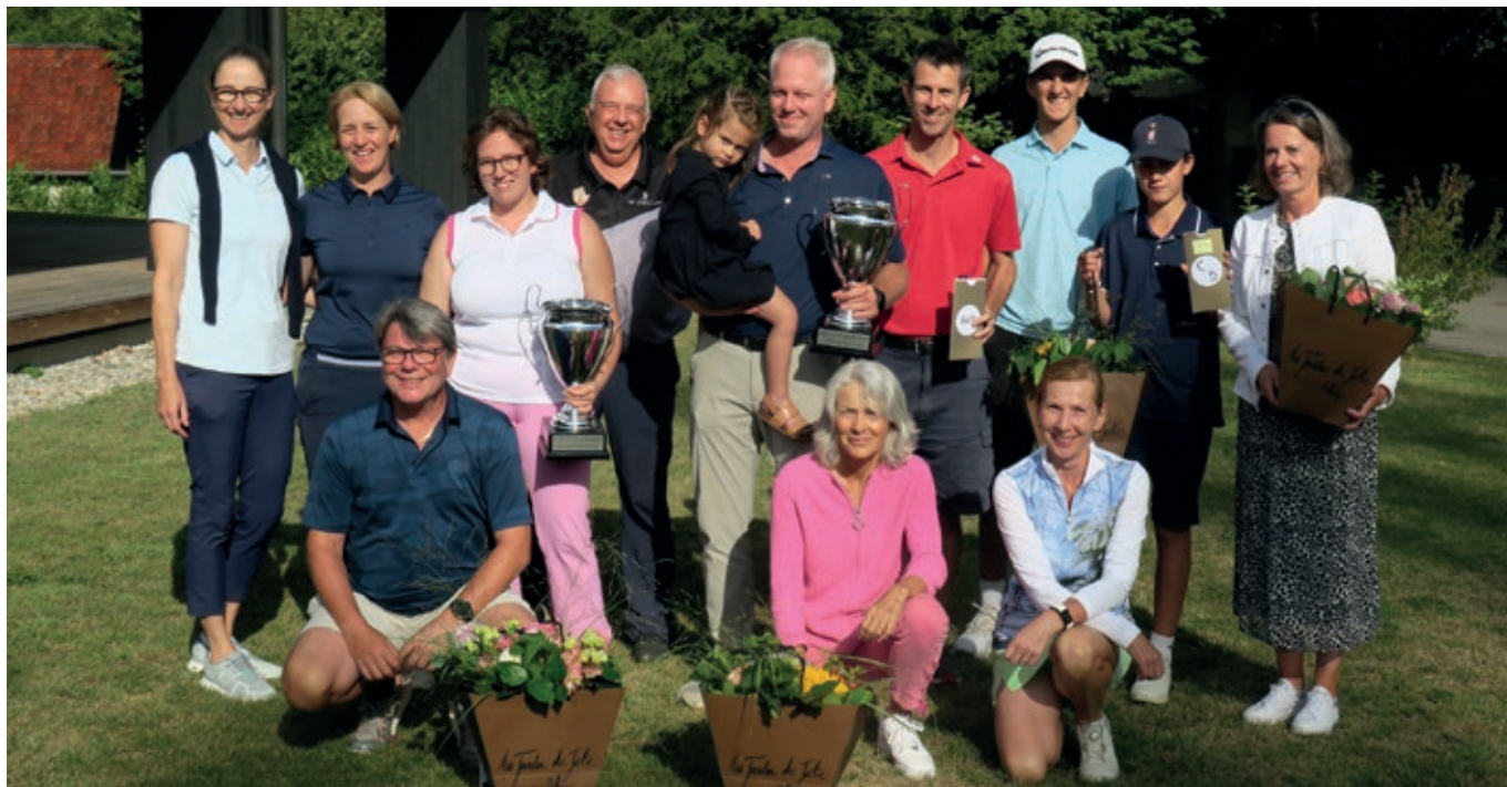
Die stolzen Siegerinnen und Sieger der Clubmeisterschaften 2024 auf Golf Saint Apollinaire.