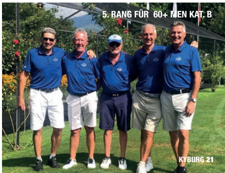
5. RANG FÜR 60+ MEN KAT. B