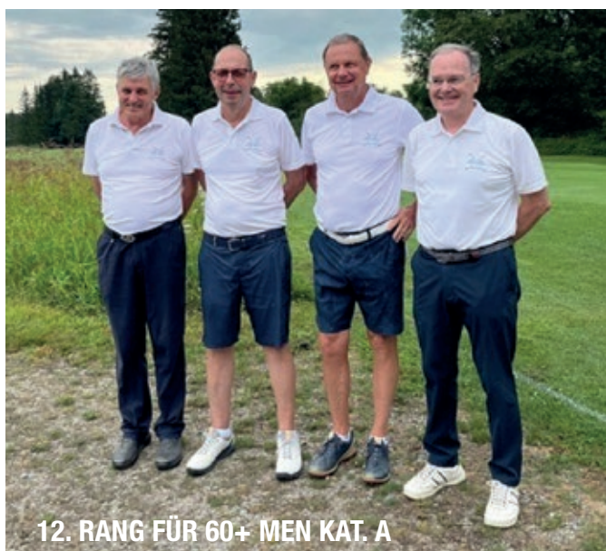
12. RANG FÜR 60+ MEN KAT. A