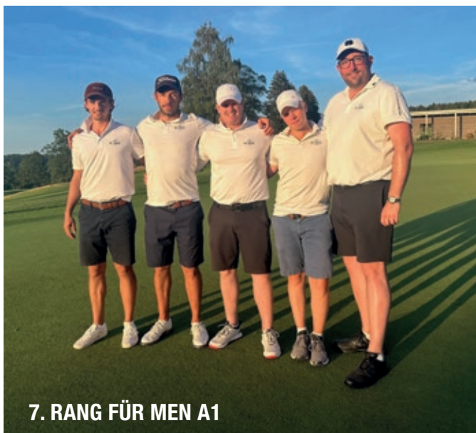
7. RANG FÜR MEN A1