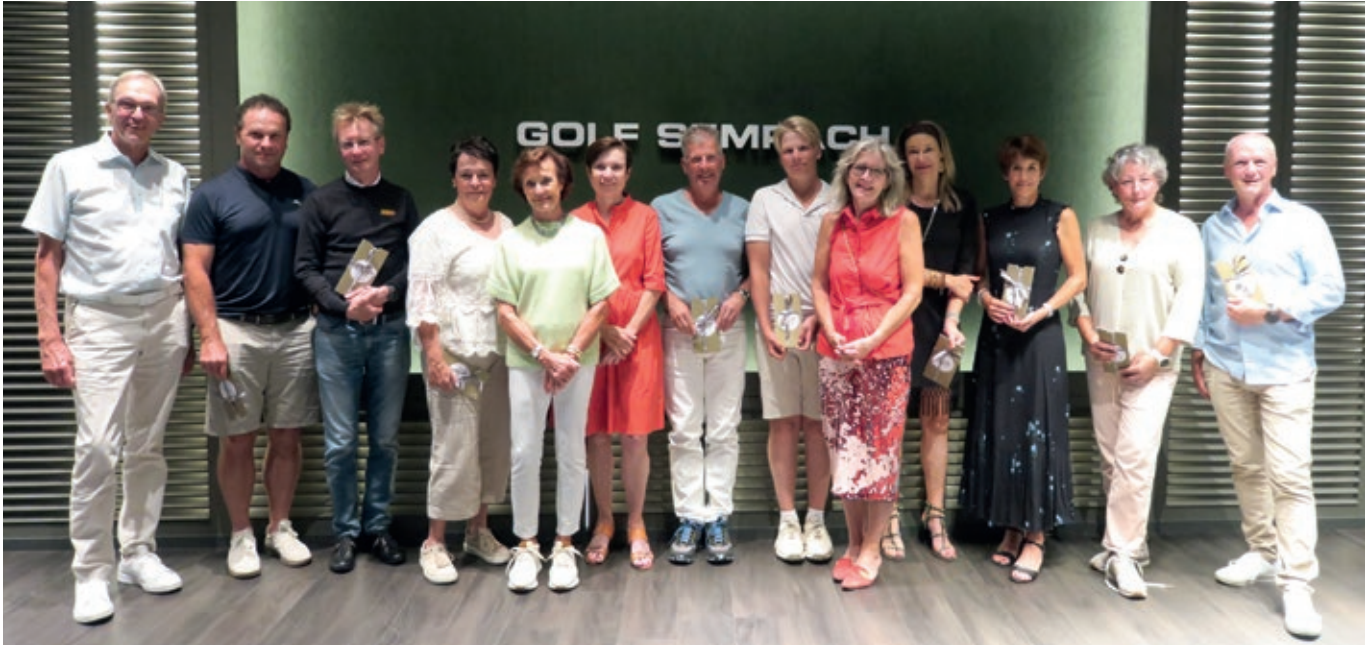
Unvergesslicher Tag voller Spannung und Spass – die strahlenden Siegerinnen und Sieger der Swiss Helvetic Flag Competition vom 1. August 2024 auf Golf Sempach.