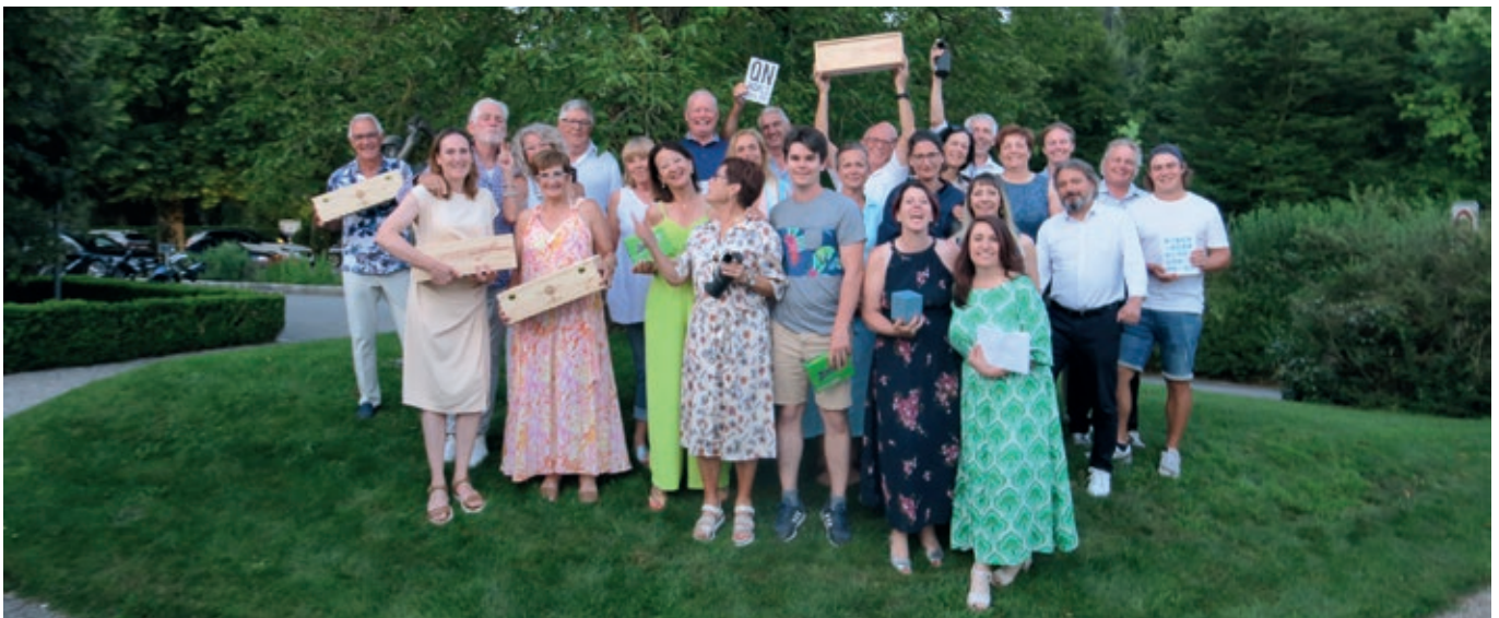
Die Mitglieder des Golf Club Kyburg feiern den Abschluss einer erfolgreichen Treasurer Trophy im Juli 2024 auf Golf Kyburg.