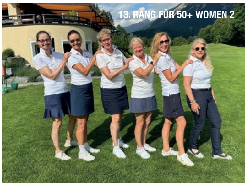
13. RANG FÜR 50+ WOMEN 2