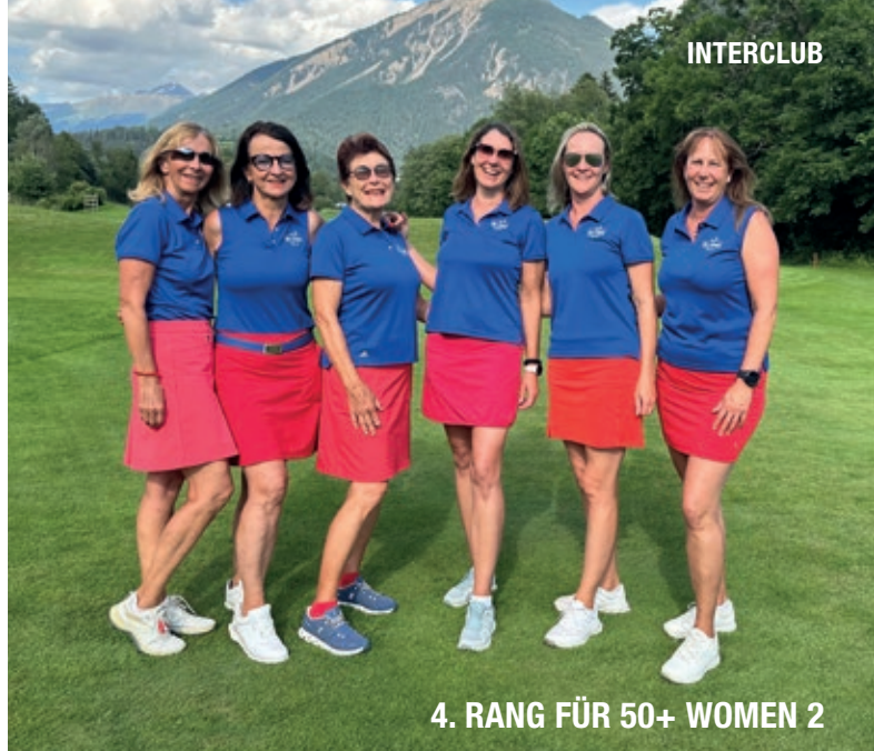
4. RANG FÜR 50+ WOMEN 2