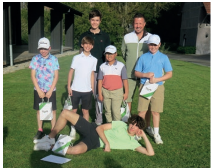
Das Spring Camp 2024 auf Golf Saint Apollinaire übertraf alle Erwartungen.