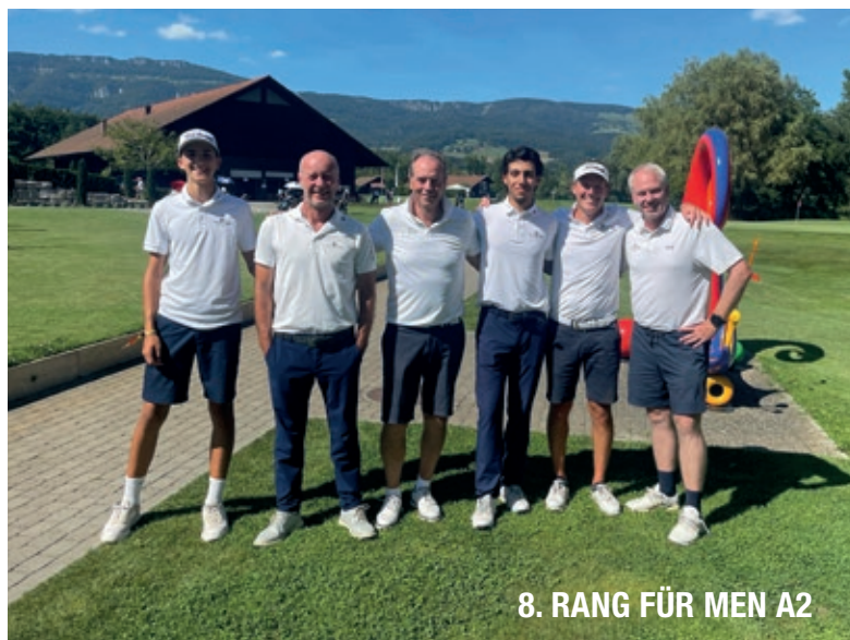
8. RANG FÜR MEN A2