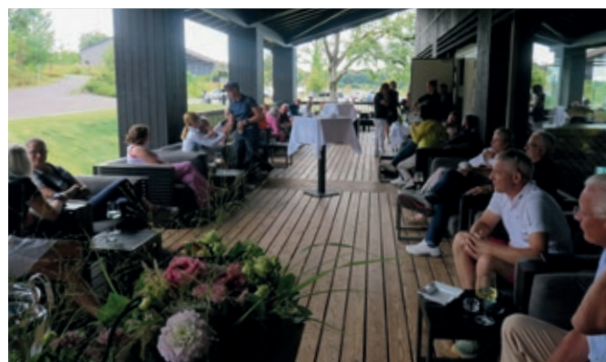
Wohlverdienter Apéro auf der Terrasse des Restaurants «Das Refektorium».