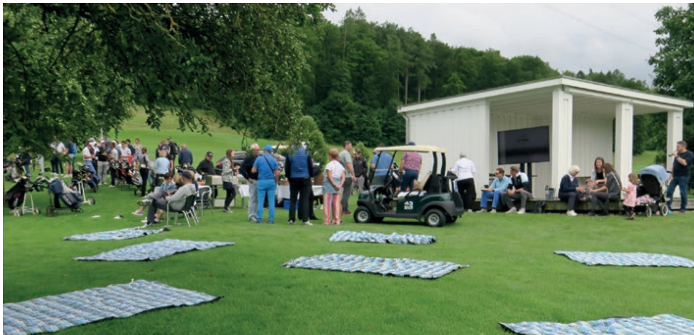
Die Zuschauerinnen und Zuschauer verfolgen gespannt das Geschehen der Clubmeisterschaften 2024.