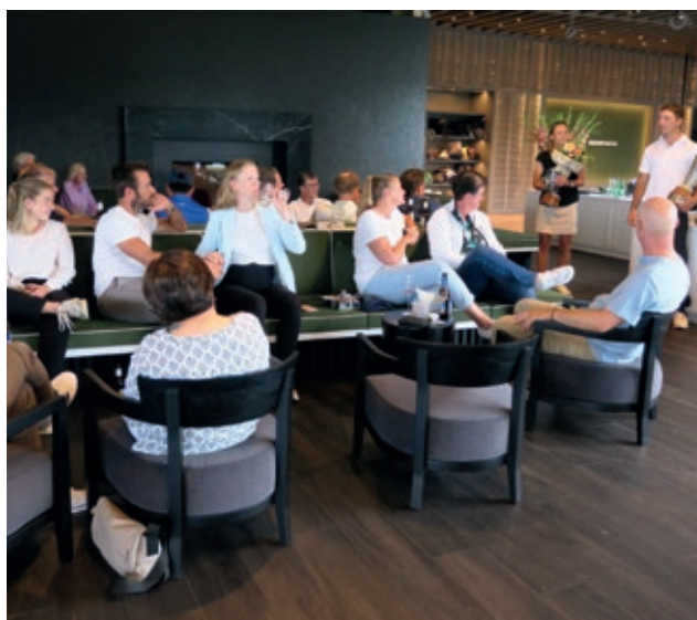
Die Teilnehmerinnen und Teilnehmer lauschen gespannt den Siegesreden der frisch gekürten Clubmeisterin und des Clubmeisters 2024.