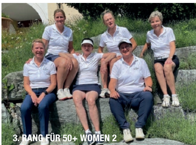
3. RANG FÜR 50+ WOMEN 2