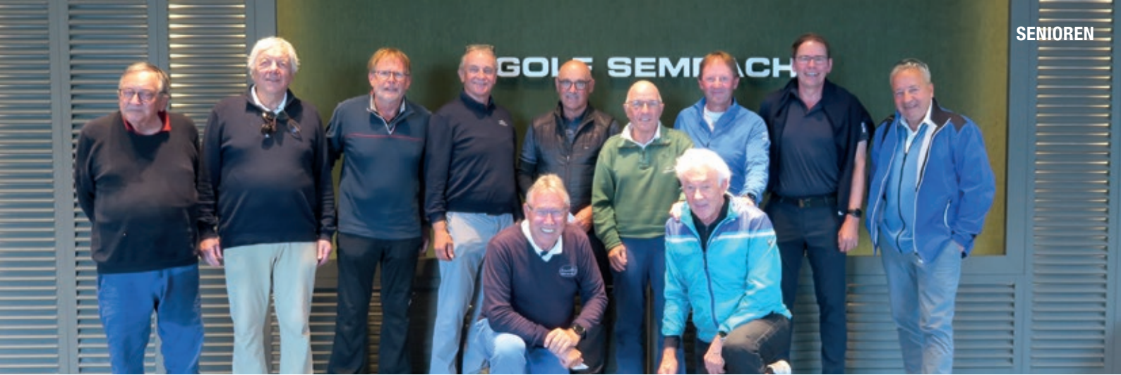
Die motivierten Teilnehmer der diesjährigen Senioren Spring Trophy 1. Eclectic im Mai 2024.