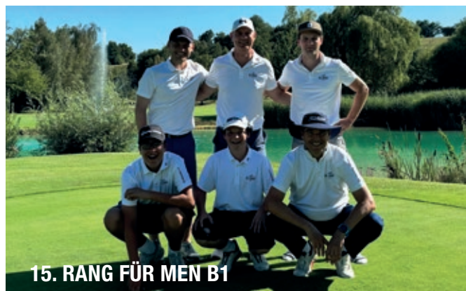
15. RANG FÜR MEN B1