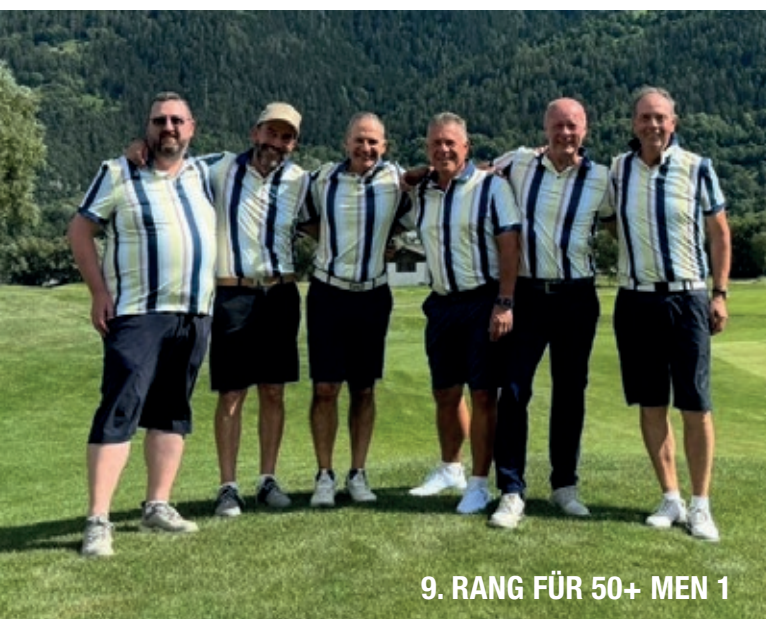
9. RANG FÜR 50+ MEN 1