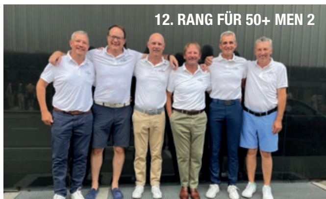
12. RANG FÜR 50+ MEN 2