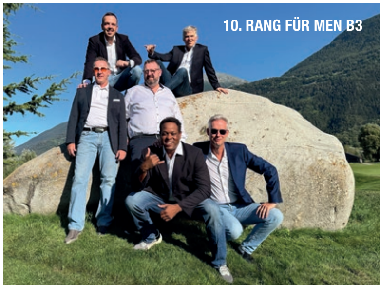
10. RANG FÜR MEN B3