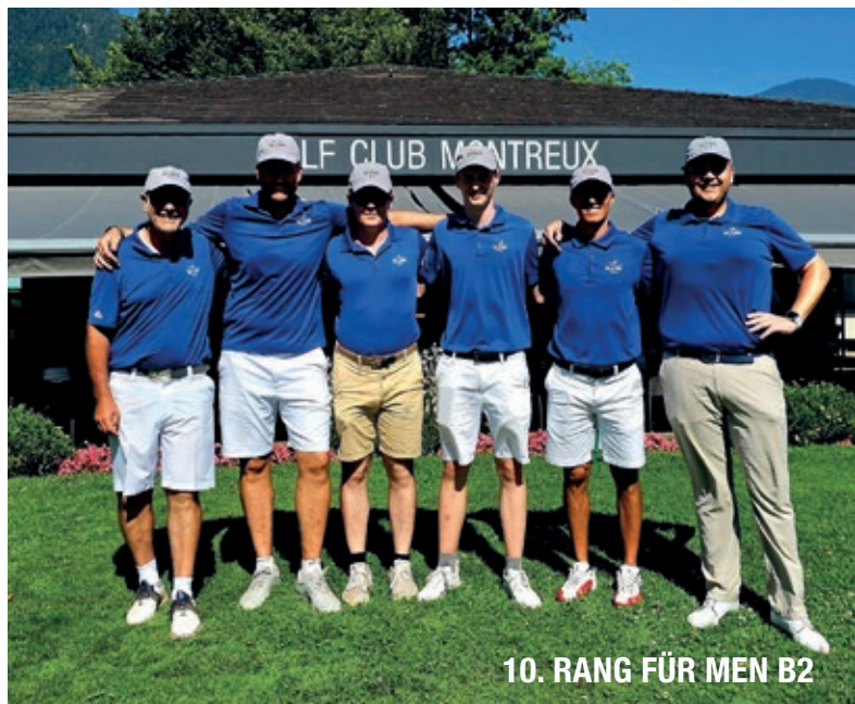
10. RANG FÜR MEN B2